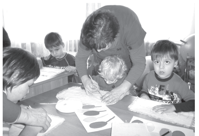
Педагоги ЦДТ помогают детям сделать первые шаги в творческом становлении

Центр детского творчества посещают 1150 учащихся, которые распределены в 43 творческих объединения. Здесь точно можно най-