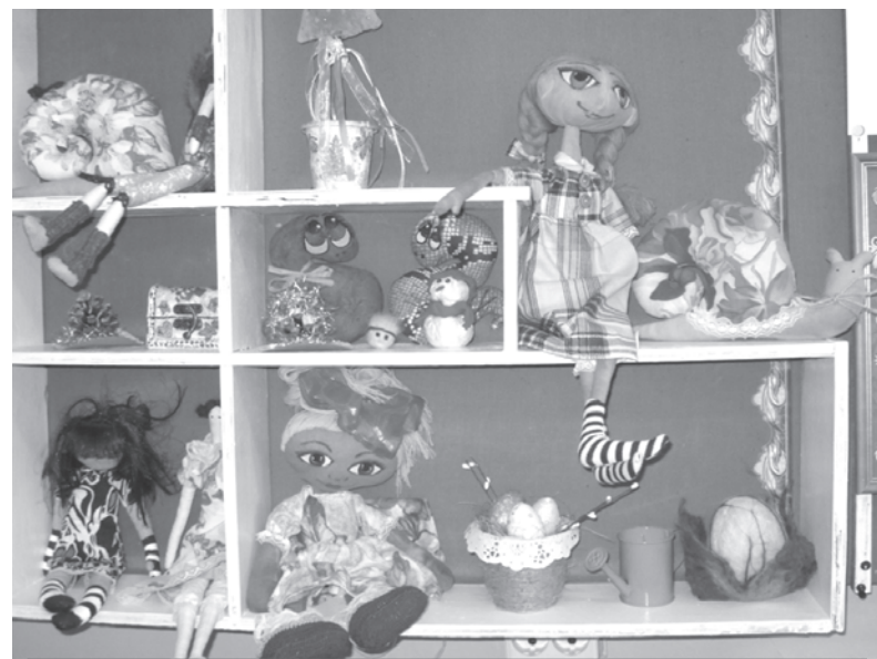
Эти работы воспитанников Центра детского творчества - лишь малая часть того, что сделано их умелыми руками

Деятельность учреждения осуществляется посредством реализации специальных программ по 5 направлениям: художествен-